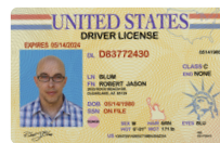
ID del Estado o carné de conducir o REAL ID (llévalo encima cuando salgas)