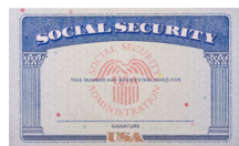
Tarjeta de Seguridad Social*