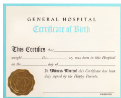
Certificado de nacimiento*

Deberás llevar dos de estos contigo para realizar los trámites laborales.